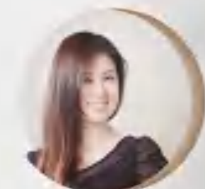
低音提琴 / Double Bass