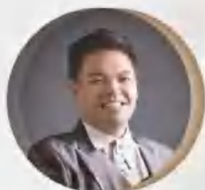
中提琴 / Viola